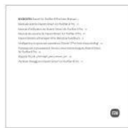
Schnellstartanleitung x 1